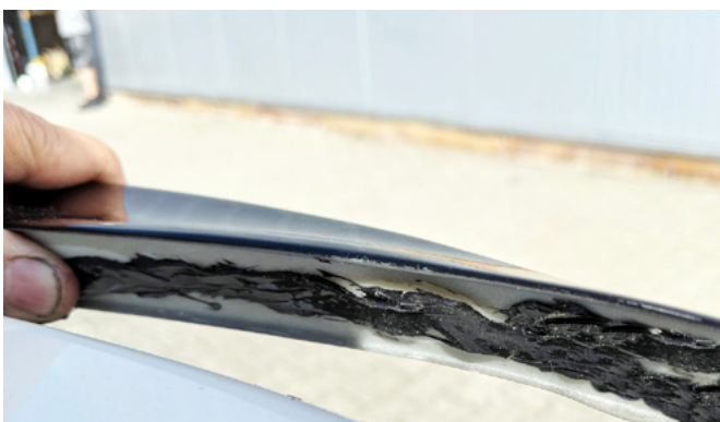
Bild 5: Innenseite vollflächig mit Betalink 1K Kleber einstreichen