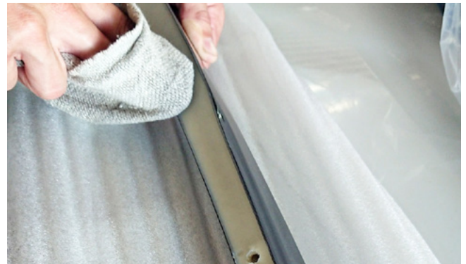
Bild 1: Innenseite des Heckspoilers mit Silikonentferner reinigen