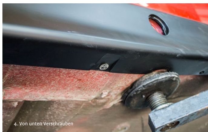
4. Von unten Verschrauben