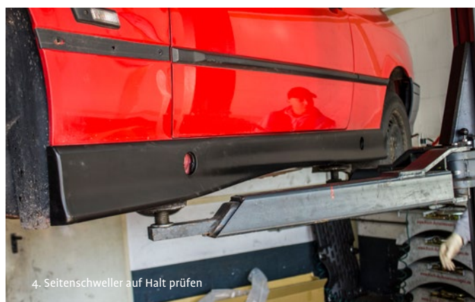
4. Seitenschweller auf Halt prüfen