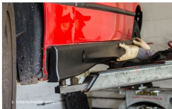
2. Seitenschweller anlegen