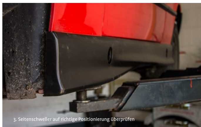
3. Seitenschweller auf richtige Positionierung überprüfen